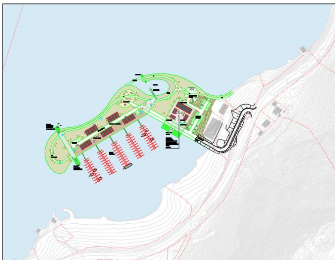
Figur 2: Skisse som viser planlagt tiltak.