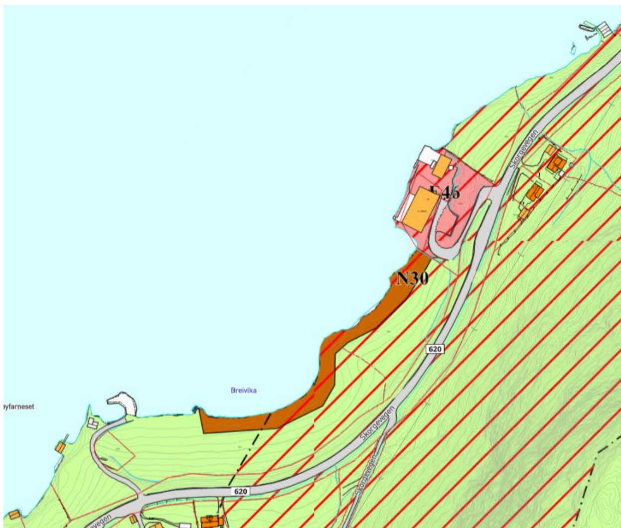
Figur 3: Utsnitt fra kommuneplanen.

I kommuneplanen er området mellom vegen og sjøen satt av til fritidsbebyggelse og landbruk. Området ved tilkomsten er satt av til annen offentlig tjenesteyting. Hele området ligger i faresone for ras og skredfare.