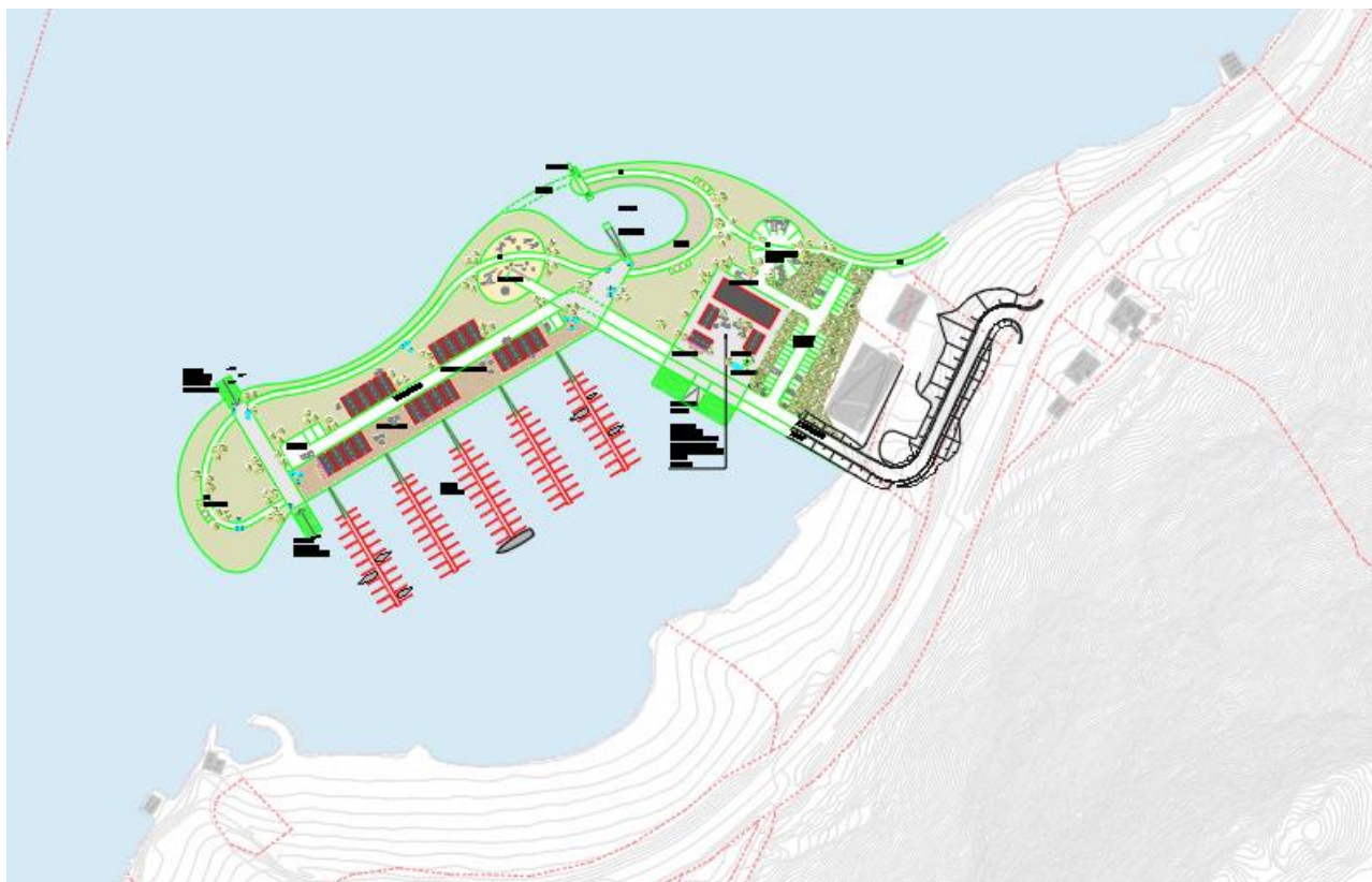
Figur 5: Skisse fremtidig situasjon.