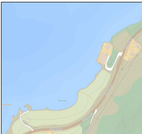
Figur 1: Kart over området. Dagens situasjon.

Det er planlagt regulert et område i Breivika til fritid og turistformål med tilhørende småbåthavn. Området ligger langs sjøen og det er tenkt utfylling med steinmasser fra Stadt skipstunnel. Fyllingen er beregnet til ca. 1 150 000 m 3 . Det er i dag tilkomst ned til området der det er etablert en industribedrift. Det er planlagt en utfylling som vil gi et ferdig utfylt område på ca. 26 000 m 2 . Den planlagte småbåthavnen og fritid- og turistområdet vil tilføre noe mer trafikk til denne avkjørselen. Det er i denne forbindelse utarbeidet dette trafikknotatet som beskriver dagens situasjon og hvordan tiltaket påvirker den trafikale situasjonen ved full utbygging av området.