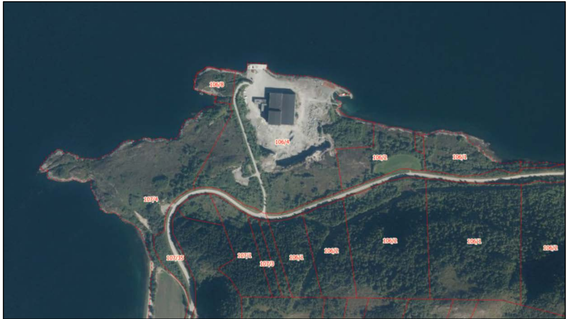
Kartet viser flyfoto av Rovde Industripark aust for Rovde sentrum. Raude linjer er eigedomsgrenser. Planområdet er omfatta av gbnr. 106/1, 2, 4, 8, 10 og 107/4. Utklipp frå www.fylkesatlas.no .