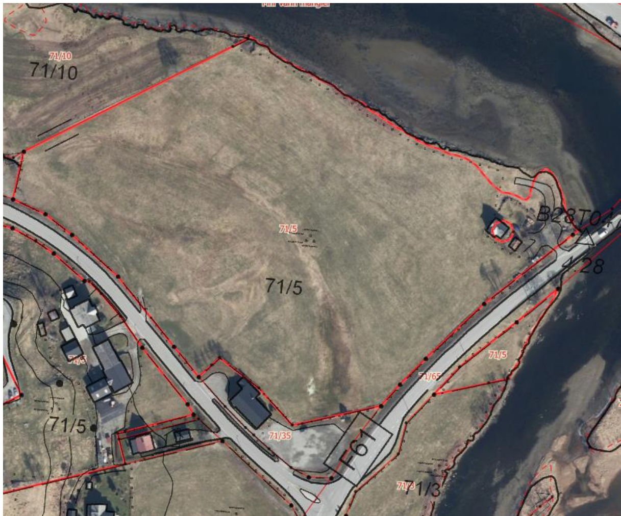
NIBIO, Kilden: N5-raster viser klassifisering fulldyrka, grunnforhold: jorddekt.