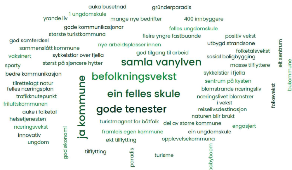
Fig. 1. Ordsky frå politisk arbeidsmøte gir eit bilete av visjonar for framtidig utvikling i Vanylven

Det er behov for betre kommunikasjon og tillit mellom kommunen og innbyggerane. Samfunnsplanen må få fram enkle og klare mål for kva kommune vil prioritere, og det må gjerast tidleg avklaring og dialog med sektormyndigheiter.